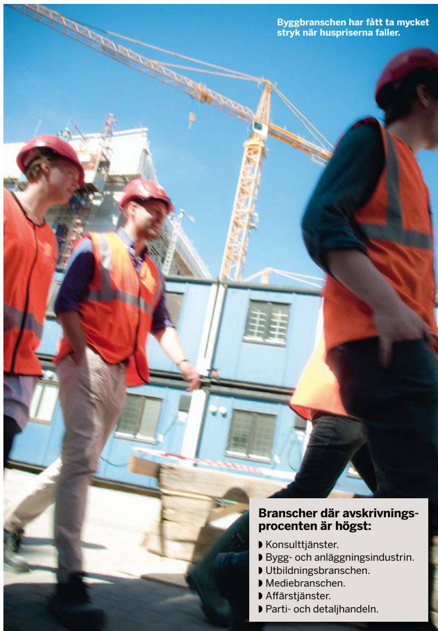
Byggbranschen har fått ta mycket stryk när huspriserna faller.