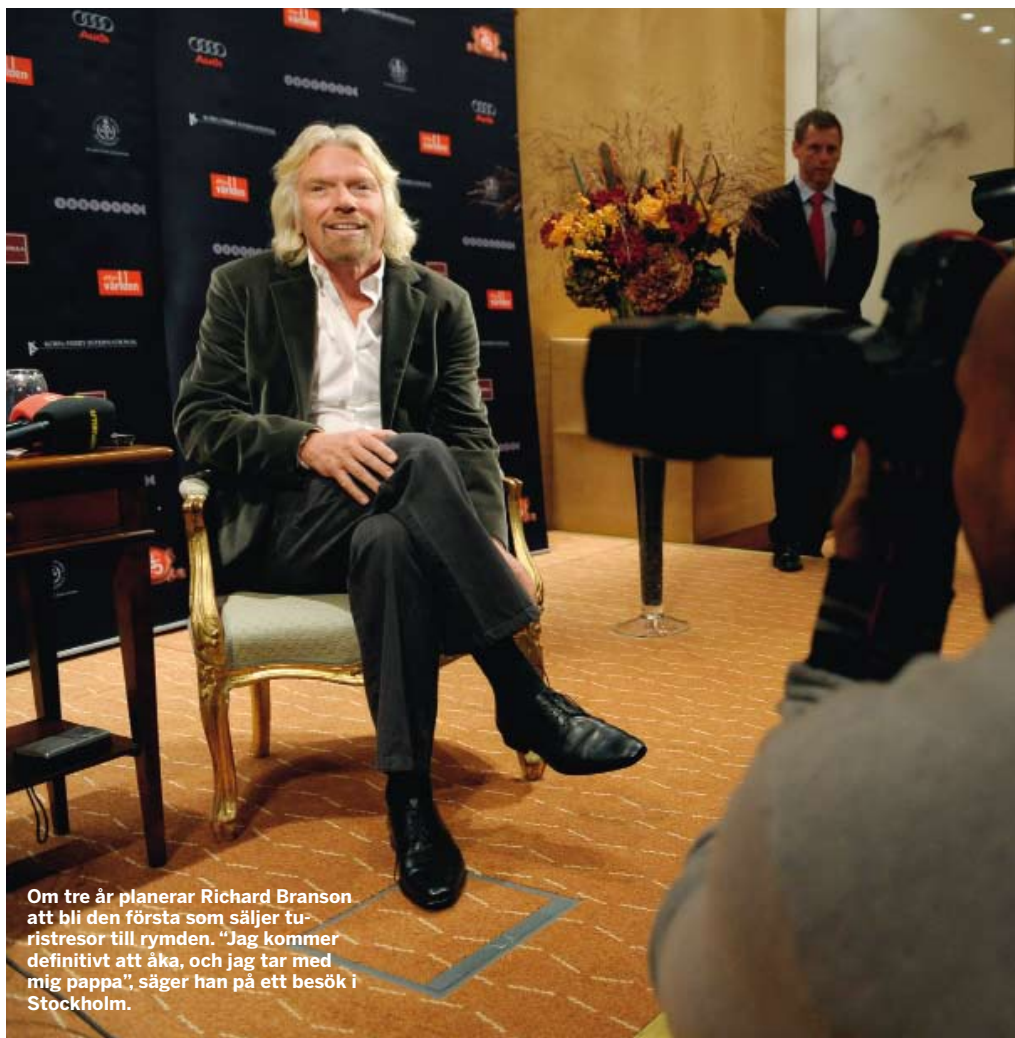
Om tre år planerar Richard Branson att bli den första som säljer turistresor till rymden. "Jag kommer definitivt att åka, och jag tar med mig pappa", säger han på ett besök i Stockholm.

– Nu är det rätt tid att växa om man har de ekonomiska resurserna, säger Richard Branson, och finansiellt starka företag har ett