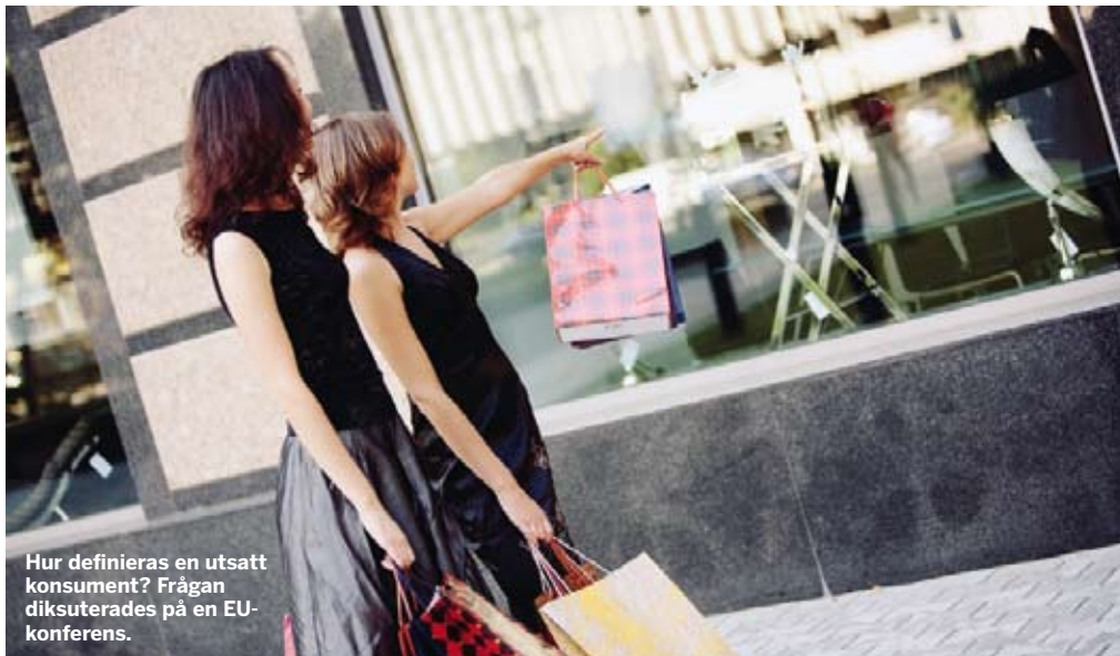
Hur definieras en utsatt konsument? Frågan diskuterades på en EU-konferens.

Flera talare uppmärksammade några lösningar som kan komma att underlätta situationen, som EU:s tjänstedirektiv (som ska vara genomfört i medlemsländerna senast i slutet av 2009) och elektronisk fakturering som kommer att införas av EU:s ledare i början av 2009.